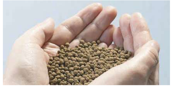
Die sprühgranulierten, pflanzenverfügbaren Dünger können direkt abgefüllt, vertrieben und auf dem Feld ausgebracht werden

niertem Nährstoffangebot für eine optimale Dosierung und Reduzierung von unerwünschten Drifterscheinungen bei der Ausbringung.