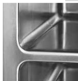
Interior of a vacuum drying oven, type VSD – as from a single mold – perfect to clean.