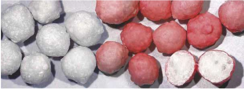
Die Düngerkörnchen können mittels Coating mit einem farbigen Branding oder mit einem pH-Wert-gesteuerten Freisetzungprofil ausgestattet werden